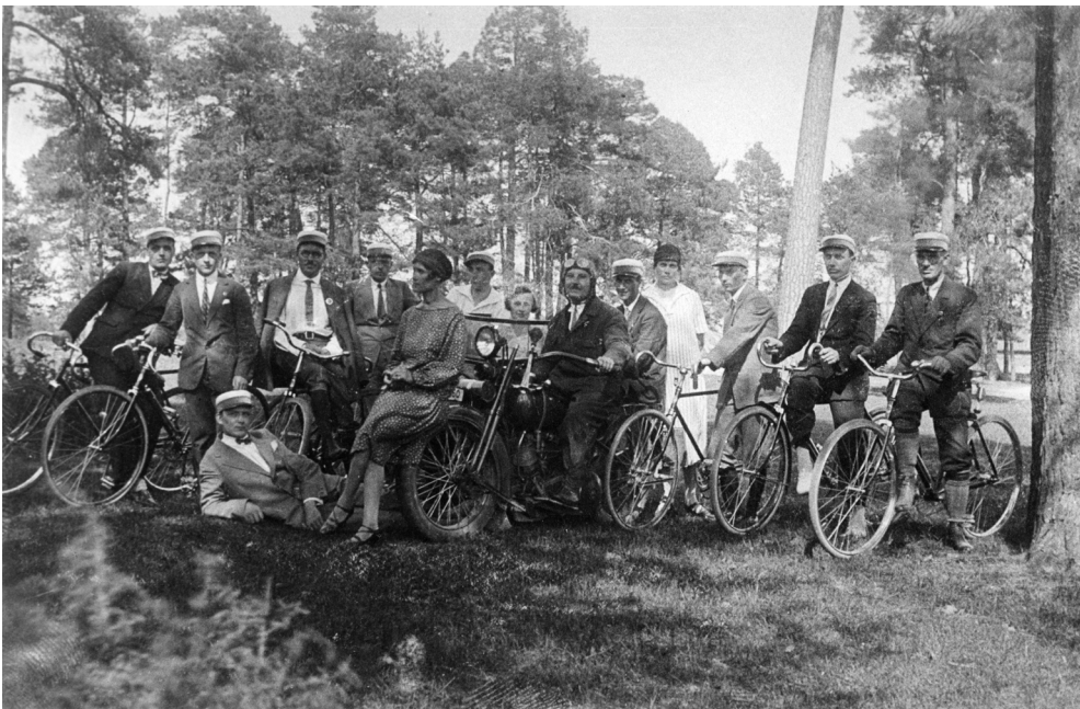
Członkowie Siedleckiego Towarzystwa Kolarskiego