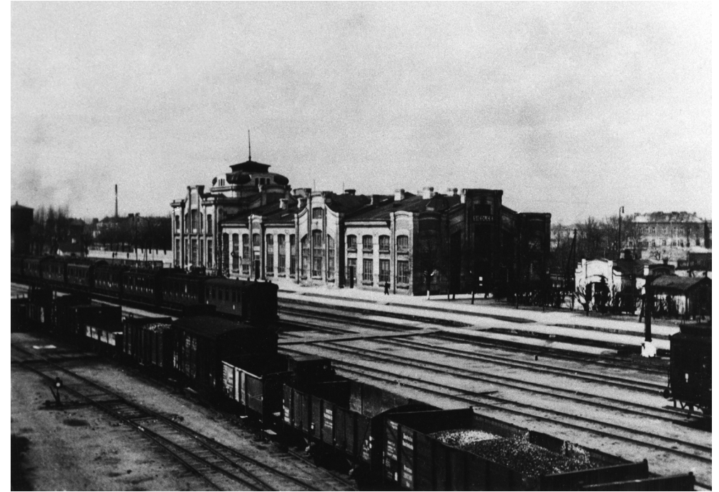
Widok na budynek dworca z mostu dla pieszych nad torami