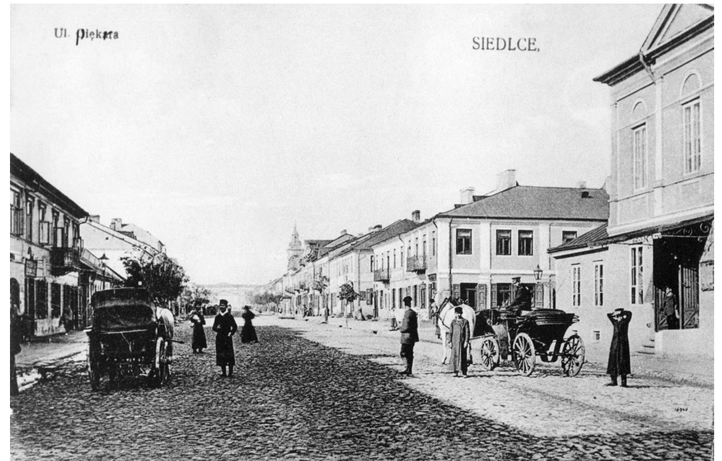
Ulica Piękna (obecnie Pułaskiego) w czasach zaborów. Pierwszy z prawej – budynek obecnego Miejskiego Ośrodka Kultury